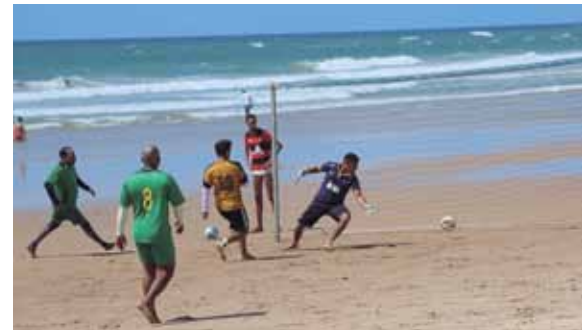
Bancários rolam a bola, na praia de Jaguaribe