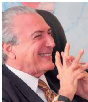
Temer, que se aposentou aos 55 anos, ri, enquanto o brasileiro pena para se aposentar