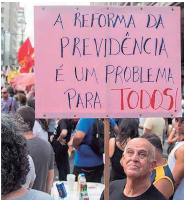
A reforma da Previdência prejudica todos os brasileiros. Fique ligado