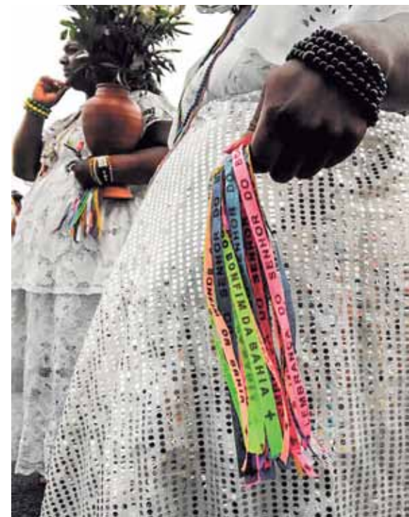
Como sempre, as baianas encantam na Lavagem

Os ataques aos direitos trabalhadores também foi a tônica da caminhada histórica. Os prejuízos causados pela reforma trabalhista e as tentativas do governo de acabar com a aposentadoria foram lembrados.