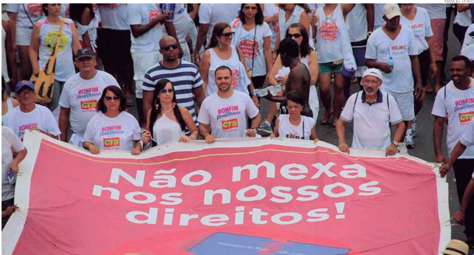
O Sindicato dos Bancários da Bahia participa da Lavagem do Bonfim e denuncia o ataque do governo Temer aos direitos dos trabalhadores