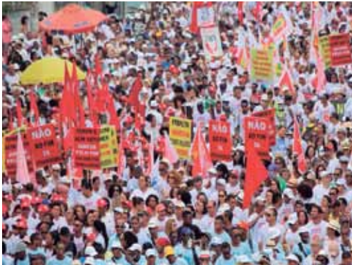
Milhares protestam na Lavagem do Bonfim

rua e comparece em massa na Lavagem do Bonfim, em Salvador. A fé de que o cenário nacional pode mudar e ficar a favor dos trabalhadores dominou o cortejo neste ano.