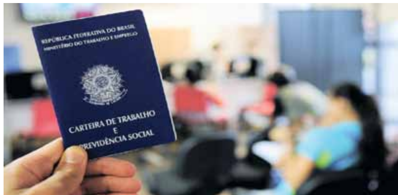
Em média, brasileiro hoje precisa de 14 meses para conseguir um emprego

Entre os desempregados, 59% são mulheres, com média de 34 anos, 54% têm até o ensino médio completo e 58% têm filhos. Dos que já trabalharam, 34% atuavam no segmento de serviços, 33% no setor de comércio e 14% na indústria.