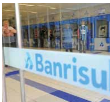
Banrisul elimina 698 empregos

O lucro representa a ganância do banco, que passa por cima dos direitos dos funcionários, com a imposição de metas absurdas, assédio moral e jornada de trabalho exaustiva, sobrecarregando os trabalhadores. No final de 2017, o banco contava com um quadro de 10.516 empregados. Já a rede de agências se manteve em 536 unidades.