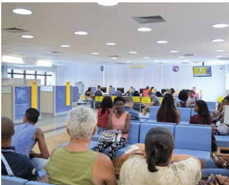
Em Salvador e RMS, as agências bancárias funcionam em horário normal