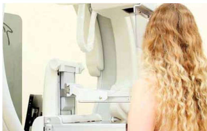
A mamografia é uma das formas de prevenção do câncer de mama

Os casos de câncer de mama podem ser evitados em cerca de 30% se medidas saudáveis forem adotadas, como praticar atividade física regularmente, manter o peso corporal adequado, evitar o consumo de bebidas alcoólicas e amamentar.