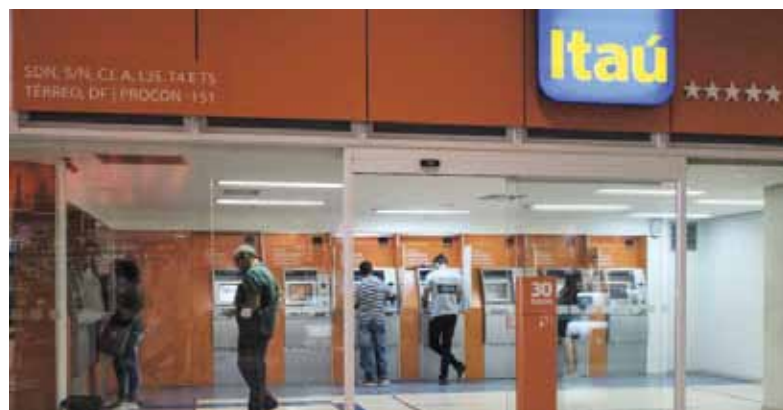
Lucrativo, Itaú é um dos bancos que mais exploram clientes com tarifas

Os funcionários do BB que perderem a função terão garantida a VCP (Verba de Caráter Provisório) por quatro meses a partir de 3 de dezembro, além da PLR integral do semestre atual e 13º salário.