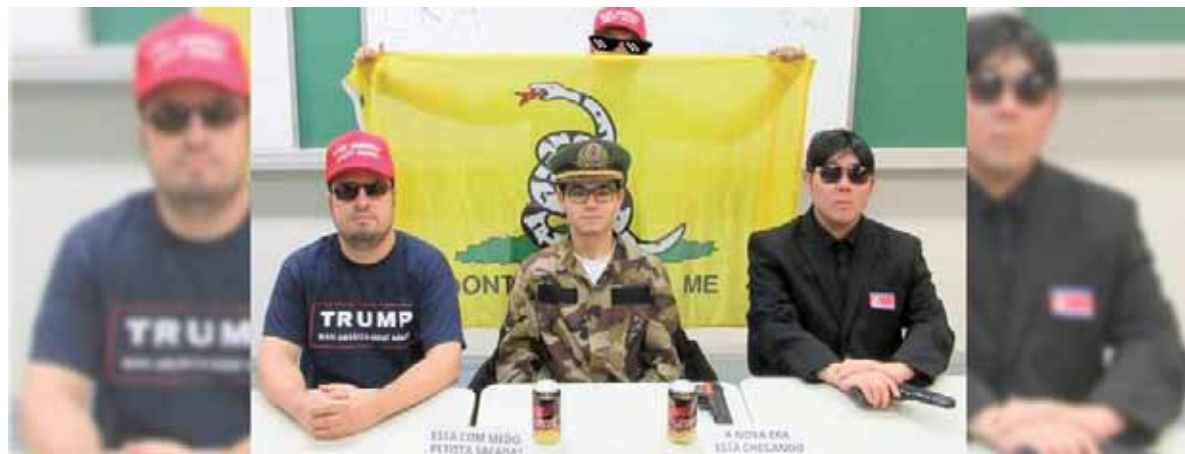
É o retrato fiel de Bolsonaro. Seria cômico, se não fosse trágico. Na USP, três estudantes invadiram a FAE armados

No Salesiano, um professor de inglês foi agredido por um eleitor bolsonarista. Na USP, três estudantes invadiram a FAE armados, anunciando nova era e fazendo ameaças em sala de aula.