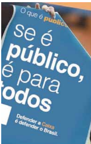
Caixa tem de continuar 100% pública

AGORA mais do que nunca as atenções estão voltadas para a Caixa, único banco 100% público atuante no país. Mas, a gestão