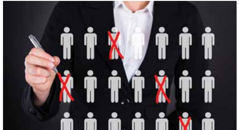
Entre janeiro e outubro, 26.455 bancários foram desligados dos bancos

A lógica dos bancos é clara. Colocam para fora quem ganha mais e contrata empregados com salário bem inferior. Se-