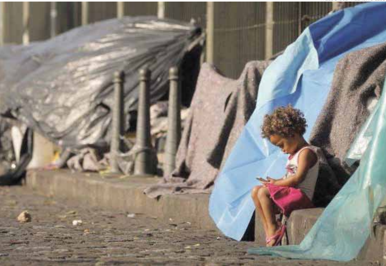
O retrato da tristeza e da desumanidade. Extrema pobreza no Brasil cresce e chega a 54,8 milhões em 2017

O governo Temer, desde que usurpou o poder, colocou em prática uma política equivocada e excludente. Com Bolsonaro não deve ser diferente. O resultado das medidas é o aumento de quase 2 milhões de brasileiros em situação de pobreza, em apenas um ano.