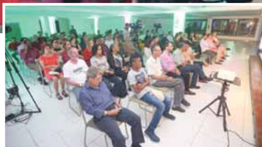
Atual e novo governo ameaçam os bancos públicos, defendidos durante debate em Salvador