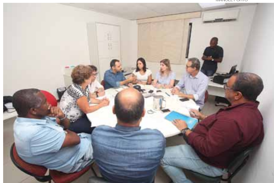
Em reunião, sindicatos e Feeb cobram que o banco PAN cumpra acordo

tadas à direção do banco na segunda-feira, segundo informaram as representantes da empresa, e até a quarta-feira os