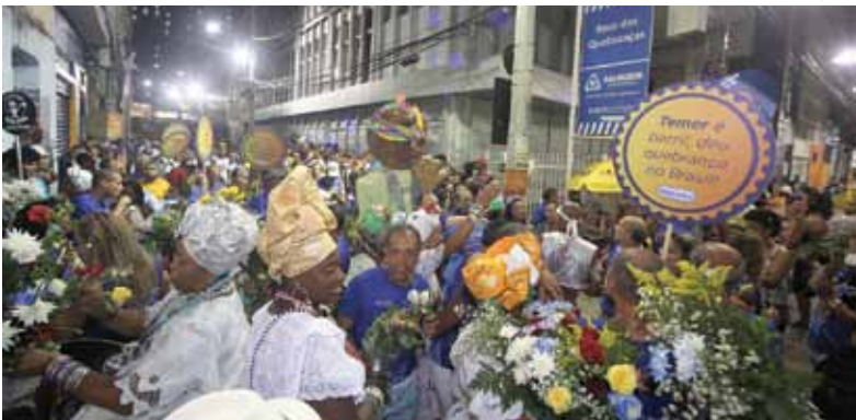
Lavagem do Beco das Quebranças leva resistência para a folia momesca