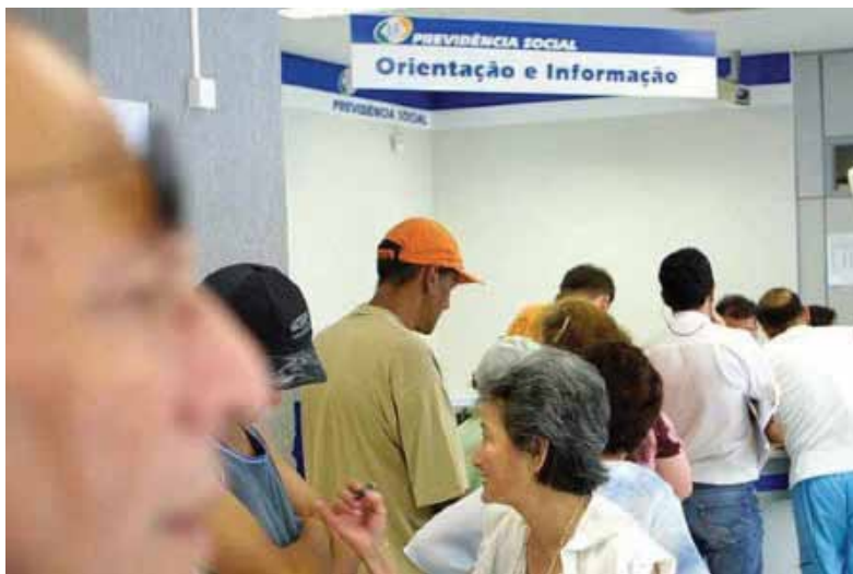
Intenção do governo é deixar de conceder R$ 4,054 bilhões em benefícios

Desta forma, pessoas que não têm condições de retornar ao trabalho são obrigadas a voltar à ativa após as perícias. Um descalço com a vida do cidadão.