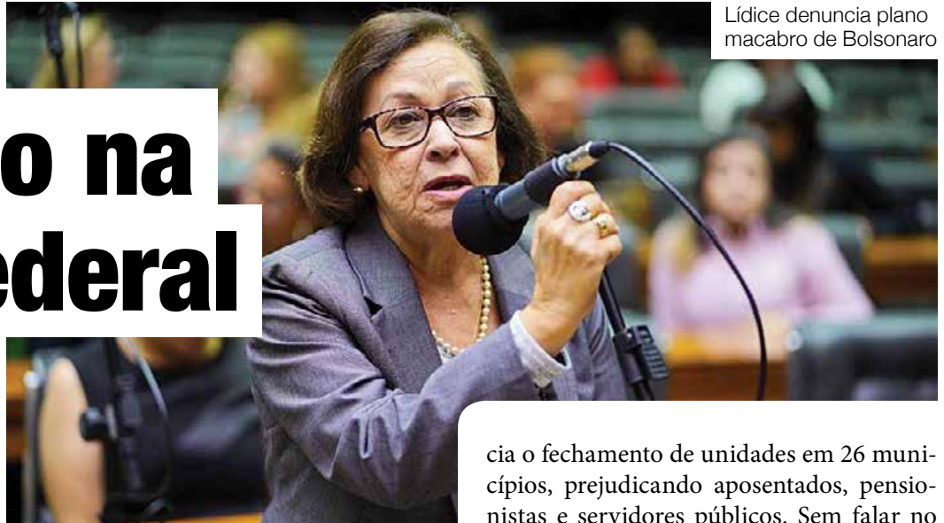
Lídice denuncia plano macabro de Bolsonaro

Deputada relata o que chama de “dizimação”