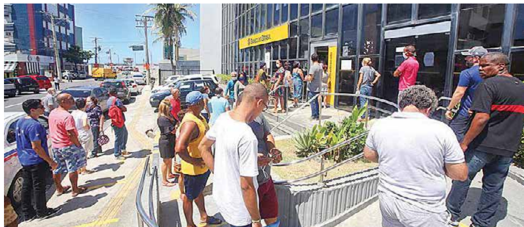
Categoria se expõe ao risco de contágio pela Covid e deve integrar grupo prioritário da vacinação

Diante da omissão do governo Bolsonaro, o Sindicato dos Bancários da Bahia am-