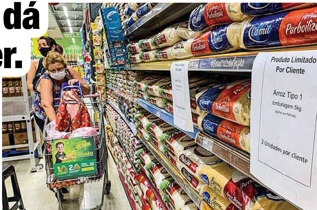
Alimentos acumulam sucessivas altas. O brasileiro tem de escolher: paga a conta ou bota comida na mesa

O levantamento mostra que do total de ocupados no trabalho doméstico, 92% são mulheres, sendo 65% negras. Quanto ao salário médio mensal, as informais ganham 40% a menos do que as formais. As negras recebem 15% a menos.