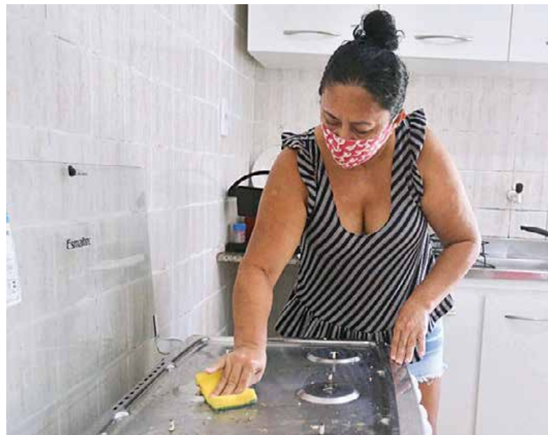
Do total de ocupados no trabalho doméstico remunerado, 92% são mulheres

A manifestação também é contra a política genocida do presidente, pelo "Fora Bolsonaro" e por auxílio emergencial de R$ 600,00 para os milhões de brasileiros atingidos pela crise sanitária.