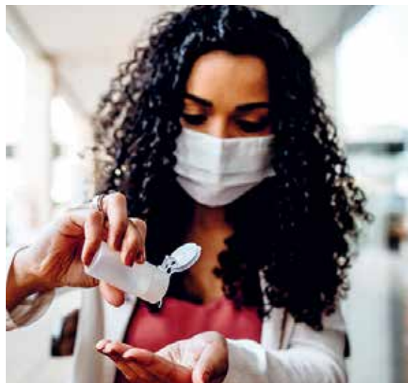
Bancário deve continuar com medidas contra a Covid

Segundo o comunicado, o trabalhador que tiver algum sintoma relacionado à Covid-19 ou gripe deve ser afastado imediatamente e procurar orientação médica. Está disponível te-