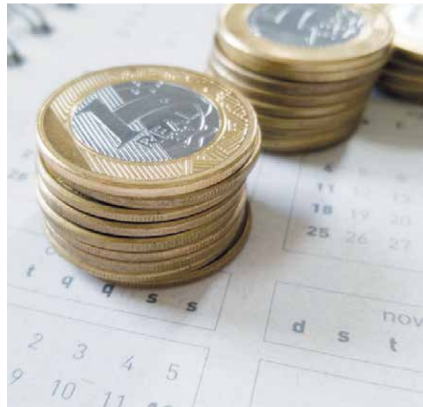
Cidadão tem de fazer mágica para sobreviver com R$ 1.212,00 no país

O número de brasileiros endividados é o maior em 11 anos e 62 milhões estão com o nome negativado. As perspectivas não são boas. Pelo menos, com o governo Bolsonaro. O real já é a quarta moeda que mais desvaloriza no mundo e o país que ocupava a 8ª posição entre as maiores economias do planeta caiu para a 12ª.