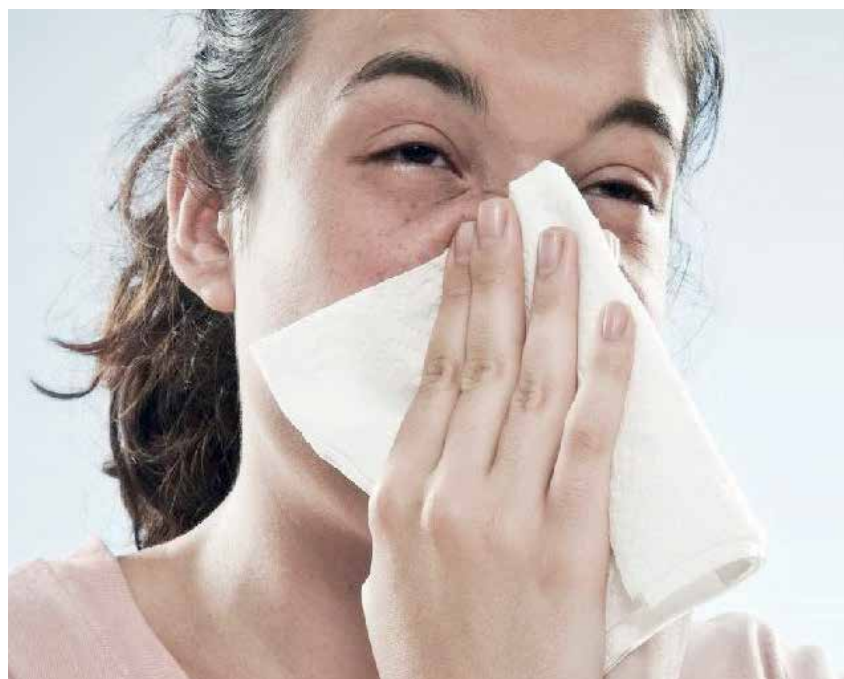
Se apresentar qualquer sintoma de gripe ou Covid, bancário deve se afastar

Outro ponto importante é não deixar de tomar as duas doses da vacina e a dose de reforço contra a Covid-19. Para evitar maior contaminação nos locais de trabalho, o ideal é que o funcionário não compareça se estiver com sintomas de Covid-19 ou Influenza. Neste caso, o bancário deve avisar ao gestor e não comparecer, realizar o teste de Covid-19 e, se possível, o para Influenza até sair o resultado.