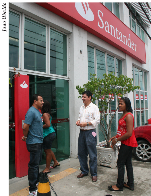
O autoatendimento foi garantido

A turma do Santander deu show de participação na greve deste ano. Em todas as agências da Bahia e Sergipe o que se viu foram portas fechadas e agências paradas. A população também colaborou, dando o necessário apoio ao movimento, afinal os clientes estão cansados de pagar tarifas abusivas e engordar o lucro dos bancos, enquanto não há a contrapartida