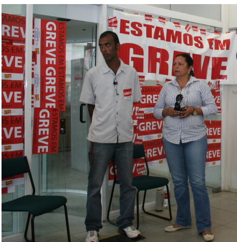
Participação feminina constante na greve

Lamentavelmente, enquanto a maioria dos bancários se concentra em fazer uma greve forte e vitoriosa, ainda existem na categoria pessoas que jogam contra o movimento. O mau exemplo na campanha deste ano ficou por conta de gerentes que tentaram abrir agência depois das 16h, ou que obrigavam funcionários a chegarem mais cedo, de madrugada até, desafiando e ameaçando o sindicato.