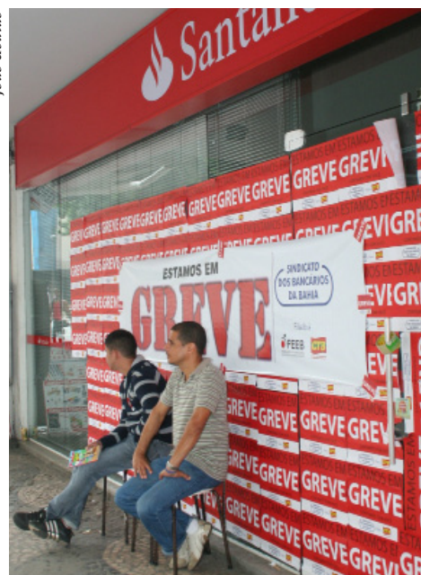
Federação dos Bancários presente na greve

É claro que essas atitudes isoladas não surtiram efeito. O sindicato está fortalecido e a categoria vacinada contra os fura-greves, que se identificam mais com os patrões do que com os colegas. Fazem pressão e ameaças, mas são os primeiros a correr para o sindicato quando recebem a carta de demissão e são descartados pelos banqueiros. ♣