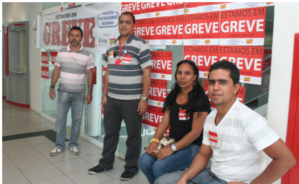
As comissões de convencimento só atuaram na orientação aos clientes. Adesão total à greve